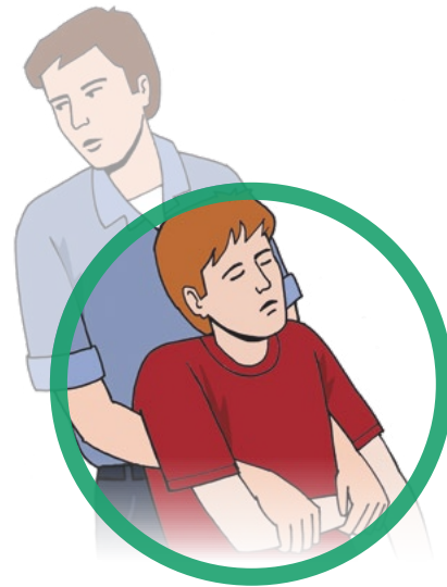
При необходимости вынести человека из опасной зоны